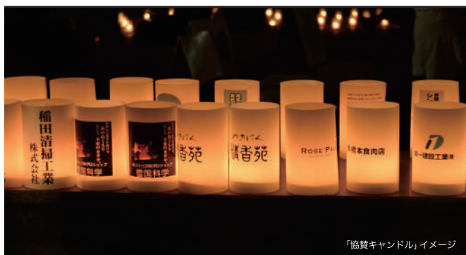
「協賛キャンドル」イメージ